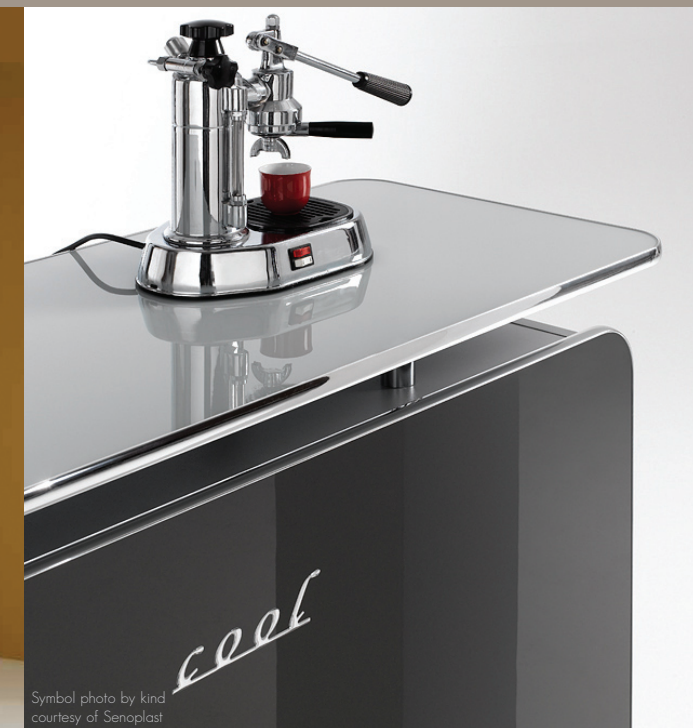
Symbol photo by kind courtesy of Senoplast