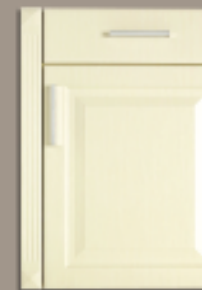
411 F76 + 738 F76*